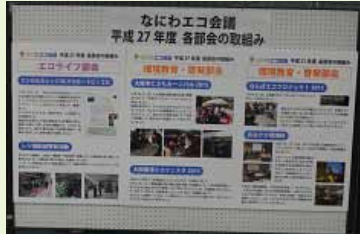
なにわエコ会議 取組紹介パネル展示

ステージ・イベントとして「省エネ・節電コンペ表彰式」、「なにわエコ会議 活動紹介」、「大阪ガス(なにわエコパートナー)活動紹介」、「省エネ・節電コンペ事例発表」として、節電大賞を受賞された特定医療法人ダイワ会大和中央病院様と、省エネユニーク賞を受賞された上島珈琲貿易株式会社UEBO店様に、事例紹介をしていただきました。