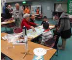
なにわエコ会議ブース エコすごろく・風力発電模型展示

今年は12月26日(土)に大阪市立港区民センターで開催し、実施する港区役所様にも協力していただきました。