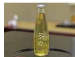
リユースびんを使った「茶々」 大阪びんリユース推進協議会