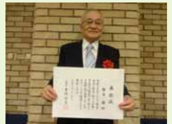
表彰式の様子(1月23日 阿倍野区民センター)